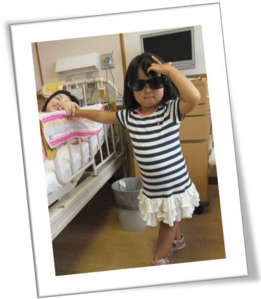
わたし、おねえちゃんになったよ。